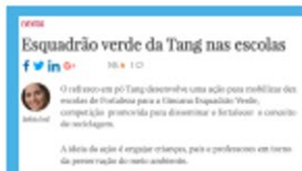
Gincana Esquadrão Verde