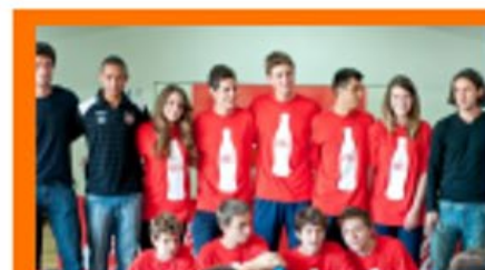
Festival Coca-Cola das Escolas