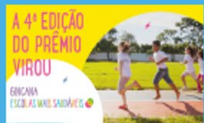
Gincana Escolas Mais Saudáveis