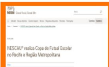
Copa de Futsal Escolar