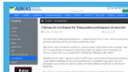
Gincana de Reciclagem