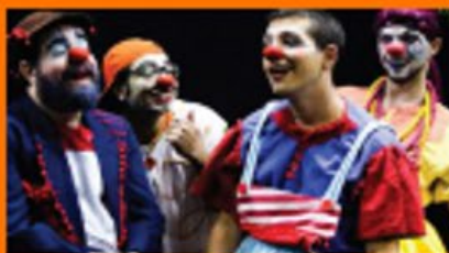
Programa 1,2,3 e saúde

Veja como são noticiadas as ações corporativas das grandes empresas de bebidas e alimentos ultraprocessados com foco nas escolas: